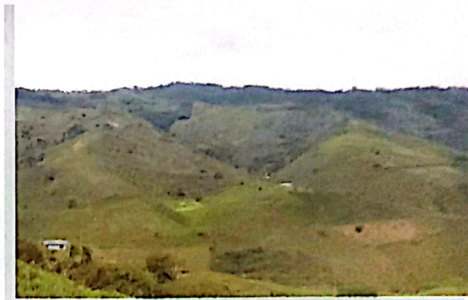
▲▼ Vista panorámica de La Cumbre

El municipio de La Cumbre está ubicado en el departamento del Valle del Cauca, en la región del suroccidente colombiano. Forma parte de la Reserva Forestal del Pacífico, junto con otros municipios del Valle del Cauca que integran la cuenca Pacífica. La cuenca hidrográfica del río Dagua se localiza en la vertiente del Pacífico de la cordillera Occidental, en jurisdicción de los municipios de Restrepo, La Cumbre, Dagua, Buenaventura, Yotoco y Vijes; su drenaje principal, que es el río Dagua, desciende de forma moderada drenando sus aguas hacia el Pacífico Colombiano. La cuenca alta, donde está ubicado el municipio de La Cumbre, se conforma por cinco subcuencas: Quebrada La Virgen, Quebrada Aguaclara, Río Grande, Río Bitaco y Río Pavas. De acuerdo con los datos de área sobre la Cuenca Alta del río Dagua, el afluente más grande es el río Bitaco, que nace en las estribaciones de la cordillera Occidental.