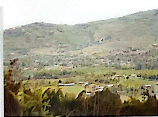
Corregimiento de Pavas ▶ ▲

Datos obtenidos del P.O.T., Municipio de La Cumbre. 2004-2007